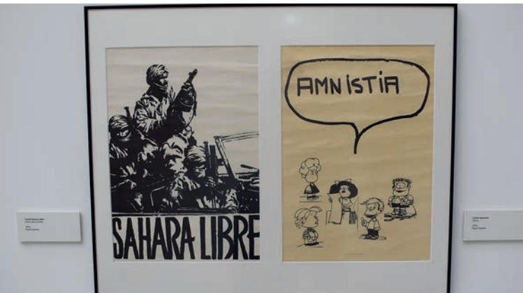
Carteles del referéndum de Andalucía; documentos y objetos de la época, con un ejemplar de Diario 16 con la primera victoria de Felipe González en portada; ilustraciones que reflejan asuntos de actualidad.

► Para poder montar la exposición ‘Los carteles de la Transición. 1975-1982’, ha habido que hacer una selección entre los más de 400 que se guardan en los Museos de Terque, probablemente la mayor colección de este tipo que hay en Andalucía y una de las dos más grandes de España, junto a la del Archivo Alejandro Molins de Tres Cantos, según revelaba Buendía.