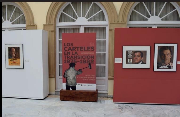
Arriba, panel central de la exposición, con carteles electorales de AP con Manuel Fraga, UCD con Adolfo Suárez y PSOE con Felipe González. A la derecha, estantería de los años 70, con banderines, un radiocasete, un teléfono fijo, cintas de música, revistas y libros, un despertador, un tocadiscos y un vinilo de la época; carteles electorales de distintos partidos con diferentes estilos de diseño; carteles para las elecciones municipales en Alhabia y Vera; y vitrina con revistas de la época. En la página anterior, pared mosaico de carteles y pintadas con la que se cierra la exposición.