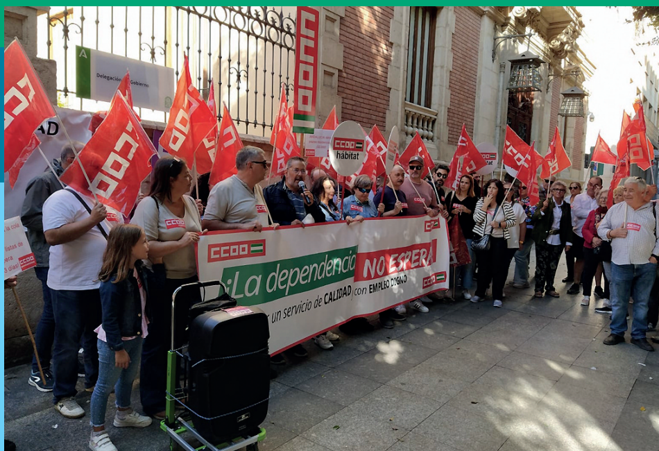
Arriba, movilización convocada por CCOO ante la sede de la Delegación del Gobierno de la Junta de Andalucía en Almería para reclamar mejoras en el servicio de atención a la dependencia.

ción de los expedientes con el objetivo de reducir las listas de espera y agilizar el acceso a las ayudas de los usuarios a los que se les ha concedido la prestación. CCOO Almería asegura también que es necesario que haya más coordinación entre las administraciones locales y autonómica para optimizar los recursos disponibles. Y señalan la importancia de contar con un sistema de seguimiento y evaluación continuo que permita detectar y corregir las deficiencias en la prestación de los servicios. Si no se aprueban medidas urgentes para solucionar los problemas que lastran el servicio de atención a la dependencia, continuarán con las movilizaciones. ■