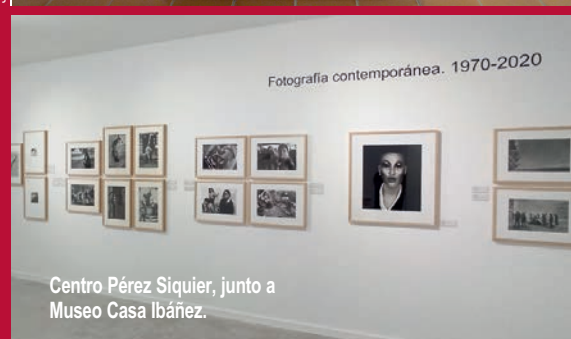
Centro Pérez Siquier, junto a Museo Casa Ibáñez.