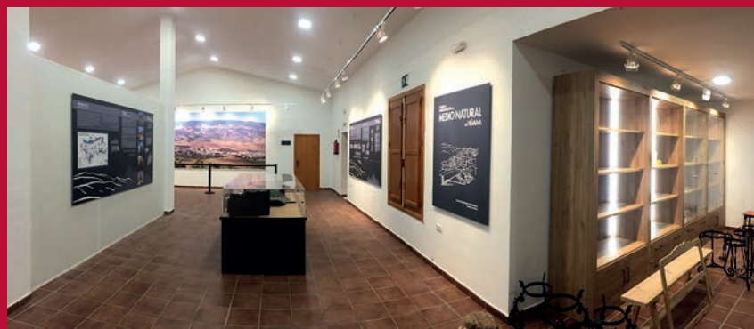
Arriba, Museo Provincial de la Uva del Barco, en Terque. A la derecha, Centro de Interpretación del Medio Natural, en Fiñana; Museo Memoria del Agua, en Níjar; Centro de Interpretación de la Alimentación Rural, en Lubrín; Centro de Interpretación de la Pesca, en Adra; y Museo de la Recreación Histórica de los Reyes Católicos, en Fiñana.