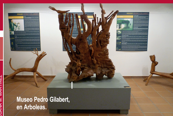
Museo Pedro Gilabert, en Arboleas.

El Museo de Adra incluye una interesante colección de arte academicista y de vanguardia del siglo XX. En su planta baja, se pueden contemplar obras de artistas como Pablo Picasso, Antonio Saura o Antonio Bédmar. También hay obras de artistas de la provincia, como el pintor abderitano Miguel Pineda, el escultor Pedro Gilabert o Jesús de Perceval, de quien se exponen dibujos. La primera planta está dedicada a las Albuferas de Adra y en la segunda se exhiben restos arqueológicos de la época de los fenicios y los romanos.