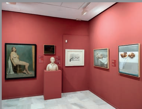
Museo de la Luminiscencia, en Pulpí; Centro de Interpretación del Mármol, en Macael; Centro de Interpretación de la Minería, en Beires; Museo Antonio Manuel Campoy, en Cuevas del Almanzora, y Museo Casa Ibáñez, en Olula del Río.

mésticos y acontecimientos religiosos, sociales y políticos que eran habituales hasta hace pocos años. Estas salas recrean una tienda de comestibles, un estanco, una panadería, una escuela, una cocina, una despensa o un dormitorio.