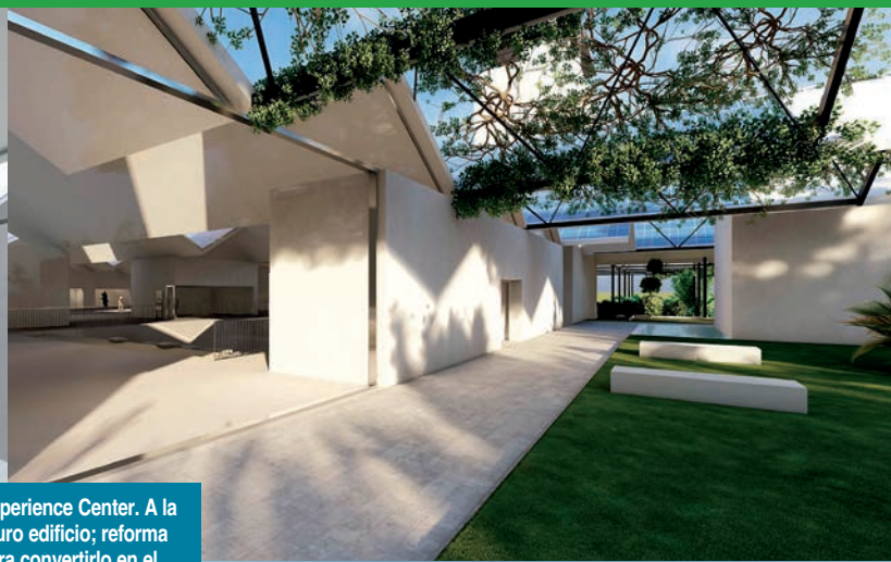
Arriba, sala del Agriculture Experience Center. A la derecha, patio exterior del futuro edificio; reforma del Cuartel de Carabineros para convertirlo en el Centro de Experiencias Gastronómicas Mar y Tierra; salón del centro gastronómico; y ubicación del Jardín Mediterráneo, junto al centro Mar y Tierra y el Castillo de Guardias Viejas. En la página anterior, el Agriculture Experience Center, con su sistema de paneles fotovoltaicos.

los volúmenes principales y toda la estructura originales.