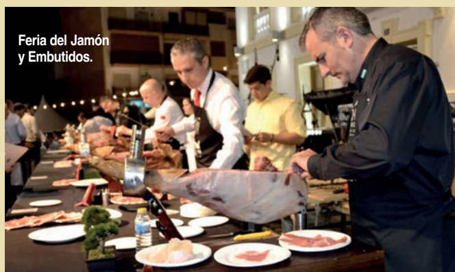
Feria del Jamón y Embutidos.

Todos estos productos se benefician de las particulares características del municipio, ubicado en la cara norte de la sierra de Filabres, con un clima más cercano al granadino que el habitual en nuestra provincia. Esto ha facilitado asimismo que el entorno natural sea especialmente apreciado por los amantes de la naturaleza y el turismo activo. Además de los caminos rurales y ramblas por los que practicar senderismo o para recorrer en bici-