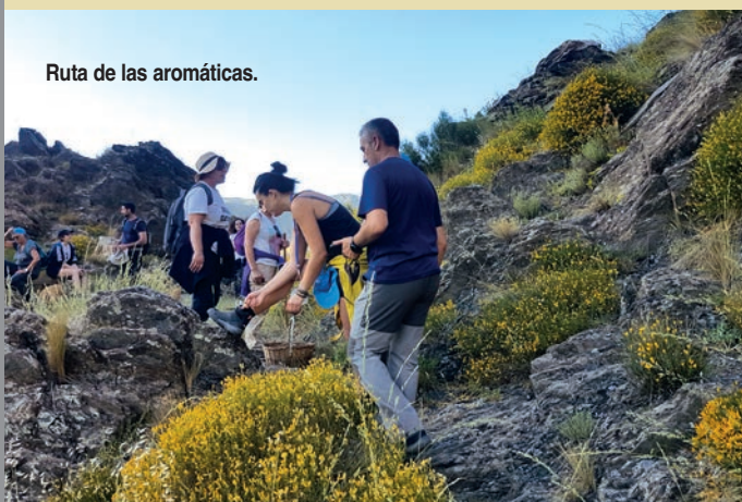
Ruta de las aromáticas.

Otra posibilidad es reservar en una casa rural, de las varias que ofrece este municipio. Son alojamientos con encanto como La Posada del Candil . Construida con criterios de sostenibilidad y materiales naturales, ofrece cinco habitaciones y un restaurante donde poder disfrutar de los mejores platos elaborados con productos de la zona. Entre sus características, destaca la apuesta por la sostenibilidad y el respeto por la naturaleza, por aplicar esos valores al turismo rural. Así, las instalaciones de la Posada del Candil son bioclimáticas, se aprovecha el agua usada, se usan energías renovables y se cultiva un huerto ecológico con cuyos productos se elaboran platos saludables.