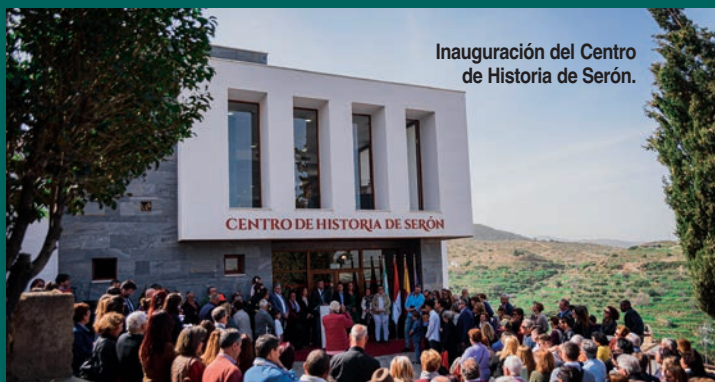
Inauguración del Centro de Historia de Serón.