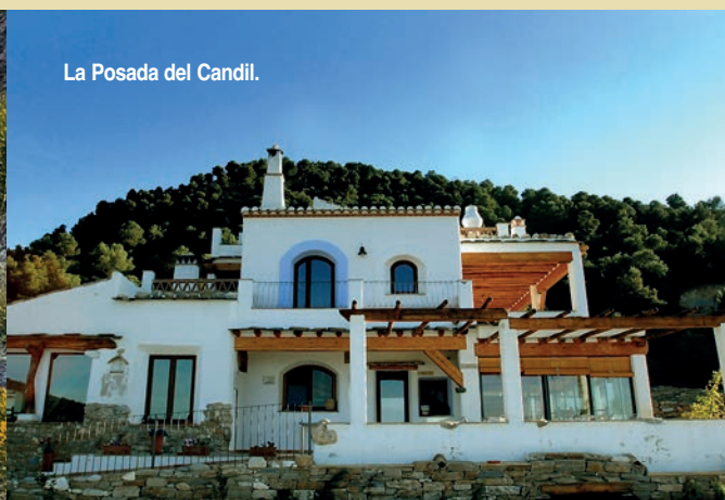
La Posada del Candil.