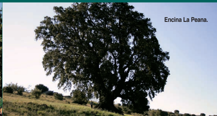
Encina La Peana.