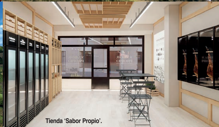
Tienda 'Sabor Propio'.