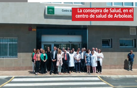
La consejera de Salud, en el centro de salud de Arboleas.

Asimismo, destaca que «por encima de otras partidas, lo fundamental son nuestros profesionales sanitarios, un capital humano de alta capacitación y extraordinario valor, cuya remuneración supone cerca del 50% de esos más de 710 millones destinados a la sanidad en Almería». En este capítulo, en Almería se ha incorporado en los últimos meses medio centenar de profesionales, sobre todo en Enfermería, con 31 nuevos enfermeros y enfermeras, nueve de ellas matronas destinadas a reforzar la atención a embarazadas en los centros de salud. ■