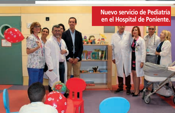
Nuevo servicio de Pediatría en el Hospital de Poniente.