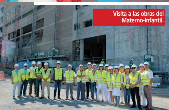
Visita a las obras del Materno-Infantil.